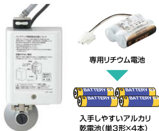
専用リチウム電池

100Vタイプとアケナジータイプを単水栓・サーモ付でご用意しました。 電気温水器セットもあります