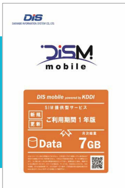
年間パックの表紙