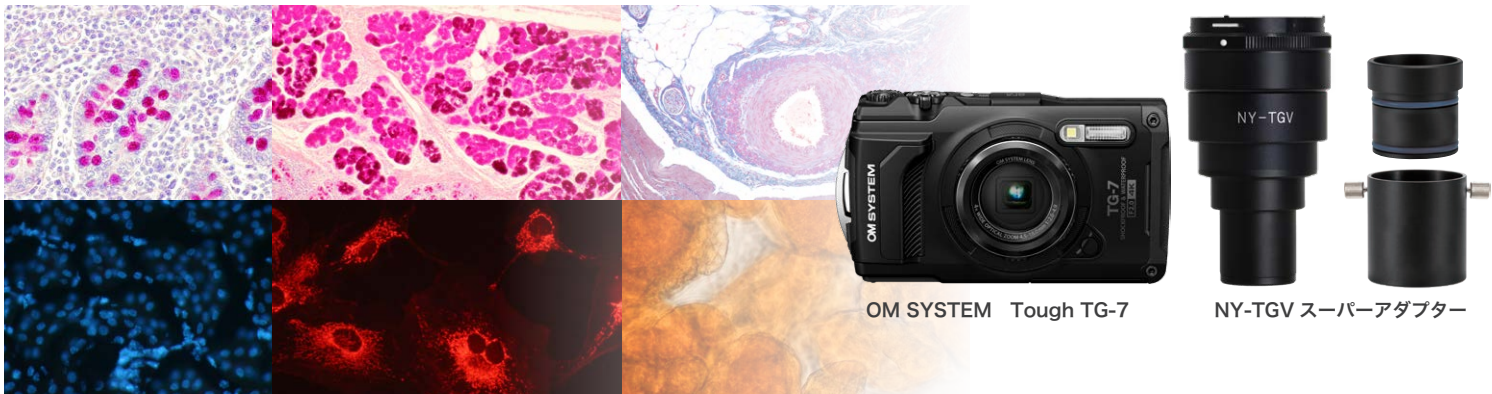
OM SYSTEM Tough TG-7