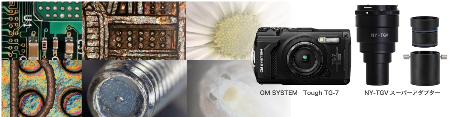
OM SYSTEM Tough TG-7