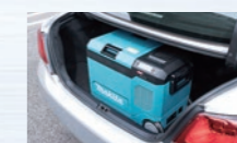
コンパクトサイズでセダンのトランクにも収納可能。 ※車種により異なります。