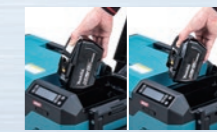
BL18120/BL1890 バッテリー取付可能。