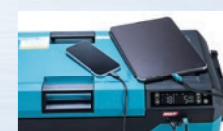
USB Type-AとType-Cの同時使用可能。(各1口) ※写真のUSB-PDケーブルは別販売品です。USB(Type-A)ケーブルは市販品です。