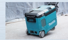
キャスタ付で現場にサッと持ち運ぶ。

CW006GZ 青/O オリーブ 40Vmax(2口並列)・18V(2口並列) 標準小売価格 116,000円(税別) NEW 本体のみ/バッテリー・充電器別売 ACアダプタ・シガーソケット用コード・インナートレイ付