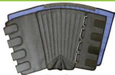
K-60 安全長脚絆(マジック)