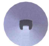
スカーフ部断面図

【縫製条件】 室温：25℃ 湿度：46% ミシン速度：4500sti/min 使用糸：スパン糸#60 生地：薄地ニット 重ね枚数：2枚 生地長さ：約27cm(130目)