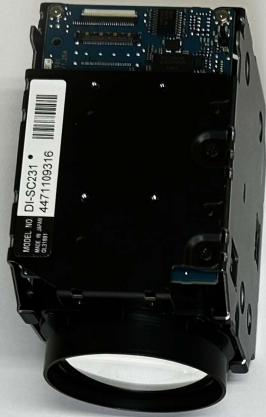
カメラモジュール本体