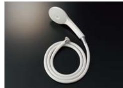
BF-SJ6BP (1.8) ¥8,500