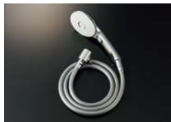
BF-SL6MBGE (1.6) -AT ¥29,700

エコアクアスイッチシャワー(めっき仕様) メタル調シルバーホース (樹脂製防カビホース) 1.6m 減圧弁付 接続ねじ:M20×1/2