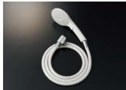
BF-SJ6MBE (1.8) -AT ¥19,200

エコアクアスイッチシャワー 樹脂製防カビホース 1.6m 減圧弁付 接続ねじ:M20×1