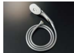
BF-SL6BG (1.8) ¥19,000

エコアクアシャワー(めっき仕様) メタル調シルバーホース (樹脂製防カビホース) 1.6m