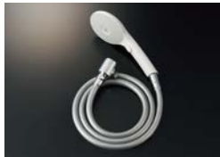
BF-SJ6MBGE (1.6) -AT ¥20,200

エコアクアスイッチシャワー メタル調シルバーホース (樹脂製防カビホース) 1.6m 減圧弁付 接続ねじ:M20×1