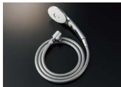
BF-SL6MBGE (1.8) -AT ¥29,700

エコアクアスイッチシャワー(めっき仕様) メタル調シルバーホース (樹脂製防カビホース) 1.6m 減圧弁付 接続ねじ:M20×1