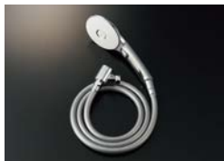
BF-SL6MBGE (1.6) -10-AT ¥29,700

エコアクアスイッチシャワー(めっき仕様) メタル調シルバーホース (樹脂製防カビホース) 1.6m 減圧弁付 接続ねじ:M20×1/2