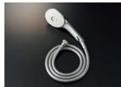
BF-SL6BG (1.6) ¥19,000

エコアクアシャワー(めっき仕様) メタル調シルバーホース (樹脂製防カビホース) 1.6m