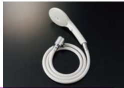
BF-SJ6MBE (1.6) -AT ¥19,200

エコアクアスイッチシャワー メタル調シルバーホース (樹脂製防カビホース) 1.6m 減圧弁付 接続ねじ:M20×1