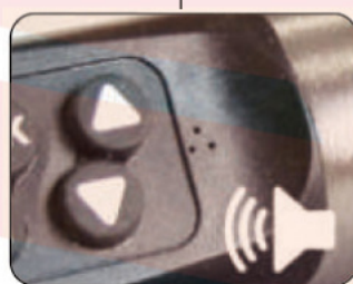
ブザー & バイブ