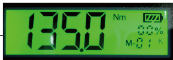
液晶ディスプレイ