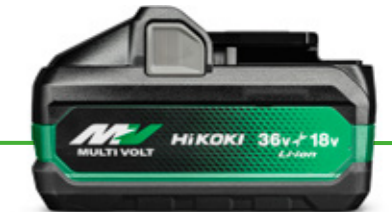
BSL 36B18X 高出力バッテリー