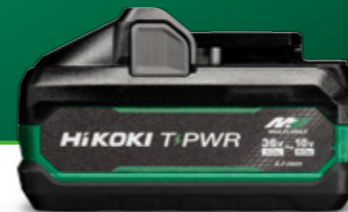
BSL 3640MVT 高出力タブレスバッテリー