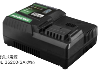
背負式電源 BL 36200(SA)対応