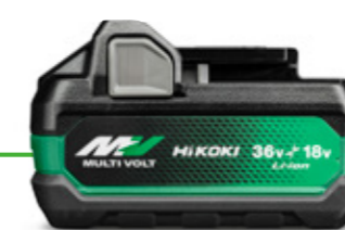
BSL 36A18X 高出力バッテリー