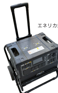
エネリカ搭載イメージ