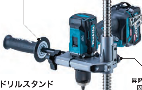
昇降スライド 固定ネジ