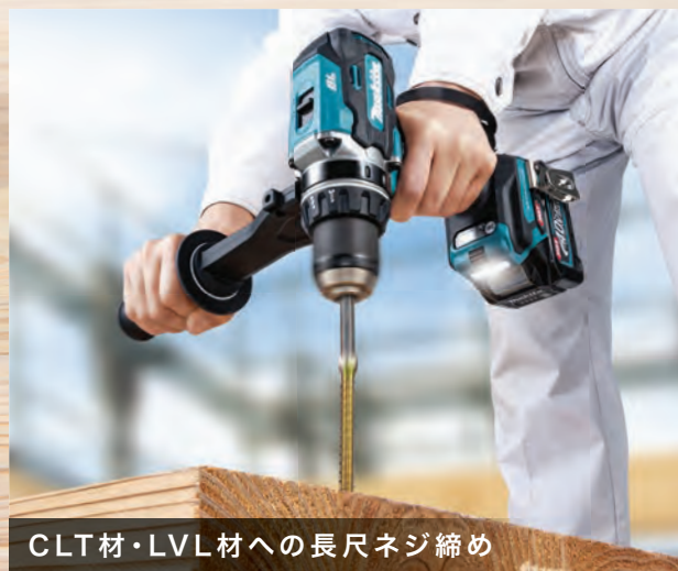
CLT材・LVL材への長尺ネジ締め