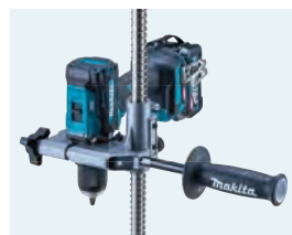
サイドグリップ付(左右取付可能)