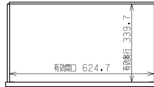
キャビネット詳細寸法