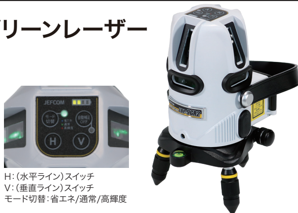
H: (水平ライン) スイッチ V: (垂直ライン) スイッチ モード切替: 省エネ/通常/高輝度