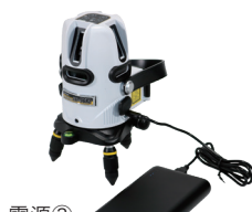
電源③ 別売モバイルバッテリー 付属USBケーブル