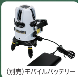
(別売)モバイルバッテリー