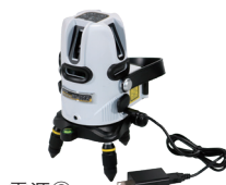
電源② 付属ACアダプタ 付属USBケーブル