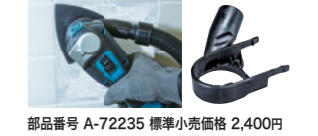
集じん機に接続し、クリーンなサンディングが可能。 部品番号 A-72235 標準小売価格 2,400円