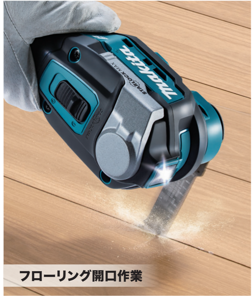
フローリング開口作業