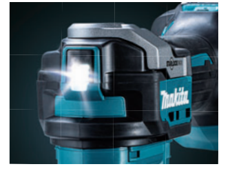
薄暗い現場でも明るく照らすLEDライト