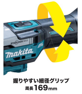
握りやすい細径グリップ 周長 169mm