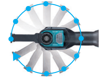
工具取付け角度 360° 作業に合わせて、30°毎に設定可能。