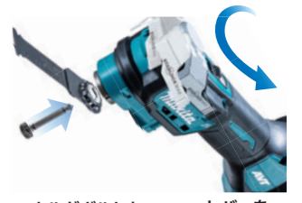
1 ホルダボルトを差込む 2 レバーを閉じて固定