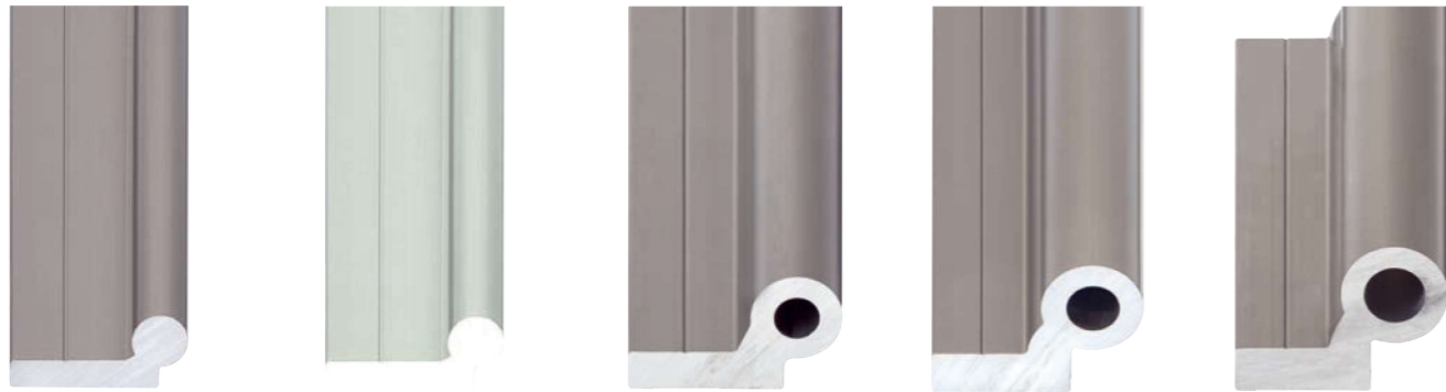
WS-10 WS-10-CA、 (クリアアルマイト処理アルミニウム) WS-16 WS-20 WS-25

i 硬質アルマイト処理表面 ▶ 43ページ クリアアルマイト処理表面 ▶ 43ページ