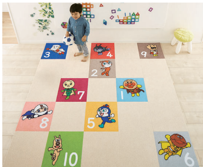
AKPN-SET10/AK2701 (アタック270 キャンバスファイン・168頁)