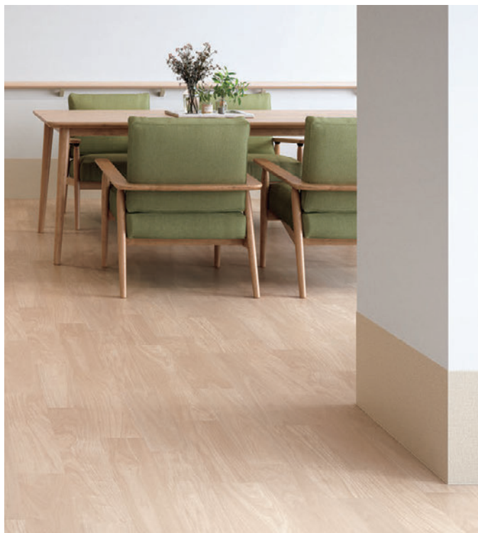
WTH300704/TS2303(ホスピリウムNW・376頁)