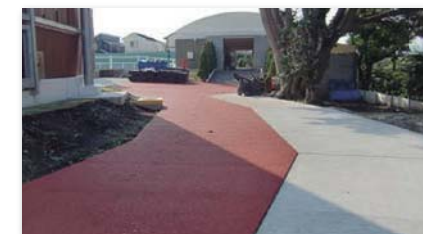
保育園・幼稚園・学校 経路