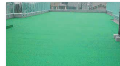
保育園屋上 有効利用 園庭