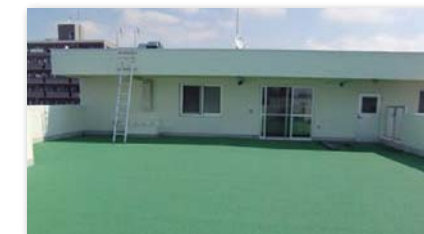
保育園屋上 有効利用 園庭