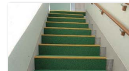
保育園・幼稚園・学校 階段