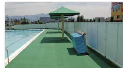
保育園・幼稚園・学校 プールサイド