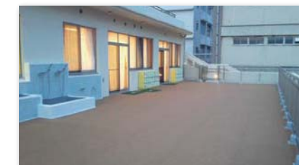
保育園屋上 有効利用 園庭