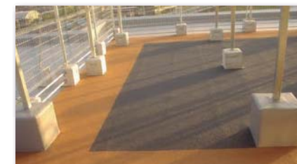
マンション屋上 有効利用 共有スペース