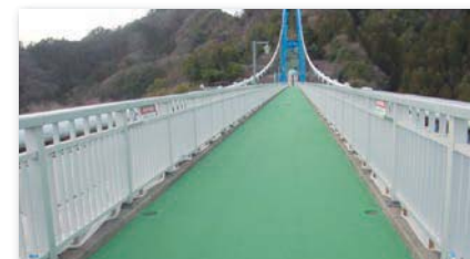
観光 吊り橋歩経路