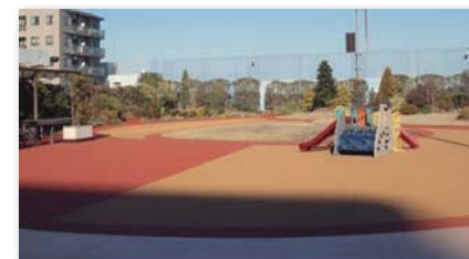
ショッピングセンター 屋上有効利用 屋上公園