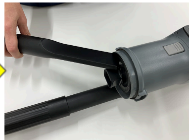
③本体側をお手入れ