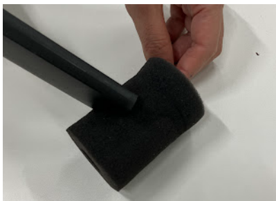
⑦スポンジをお手入れ