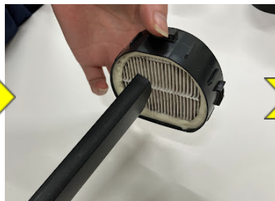
⑧HEPAフィルターお手入れ