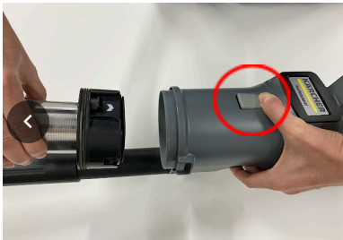
④本体ボタンを押しながら フィルターシステムを取り出す