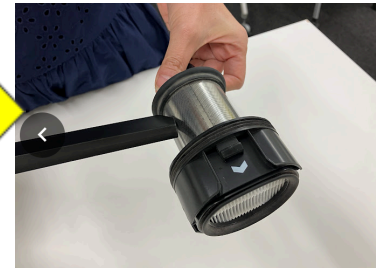
⑥フィルター部をお手入れ