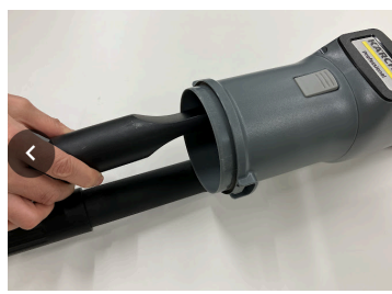
⑤本体内部をお手入れ (最奥フィルターに注意)