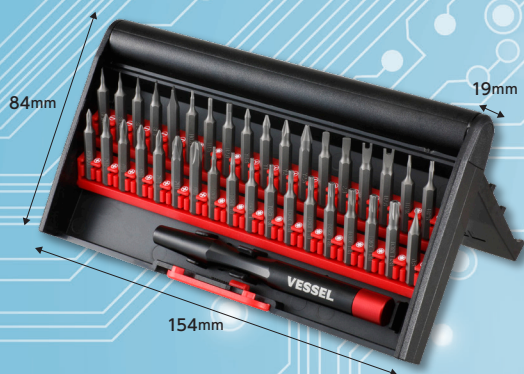
スタンド式ケース