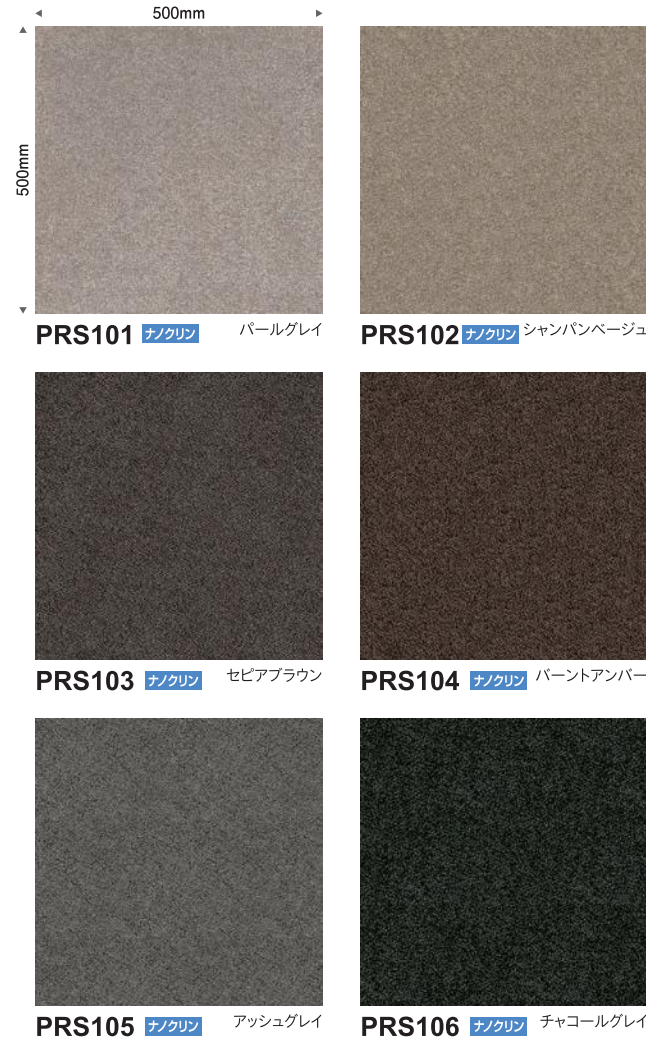
PRS101 ナノクリン パールグレイ PRS102 ナノクリン シャンパンベージュ PRS103 ナノクリン セビアブラウン PRS104 ナノクリン パーントアンバー PRS105 ナノクリン アッシュグレイ PRS106 ナノクリン チャコールグレイ