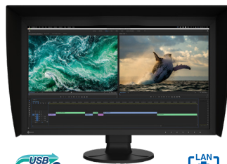
ColorEdge CG2700S 27型 WQHD(2560×1440)