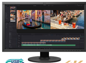
ColorEdge CS2740-Z 27型 4K UHD(3840×2160)