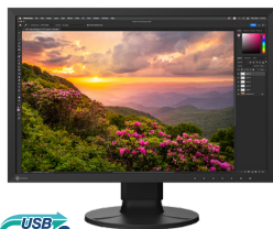
ColorEdge CS2400S 24.1型 WUXGA(1920×1200)