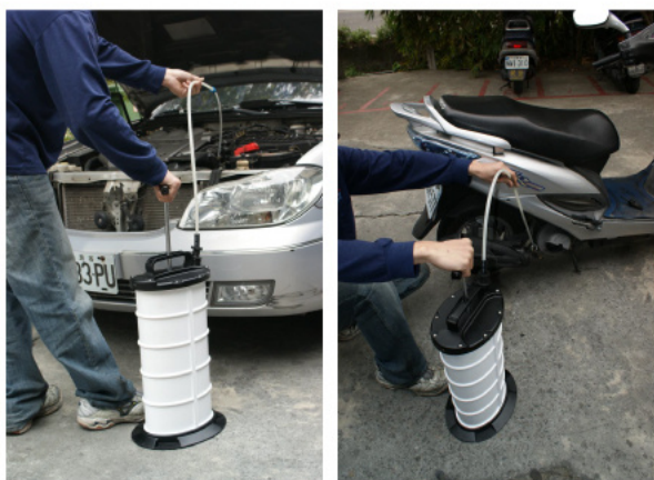
⑤延長用ホース (JTC1023A-1 : 4.5Φ×1000mm)