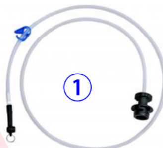
①ブレーキ用ホース (JTC1050-A : 8Φ×1500mm)