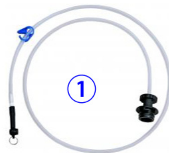
①ブレーキ用ホース (JTC1050-A : 8Φ×1500mm)