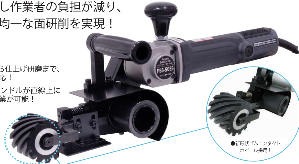
●新形状ゴムコンタクトホイール採用！