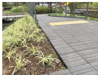
岐阜県内駅前広場