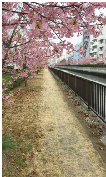
東京都内護岸緑地