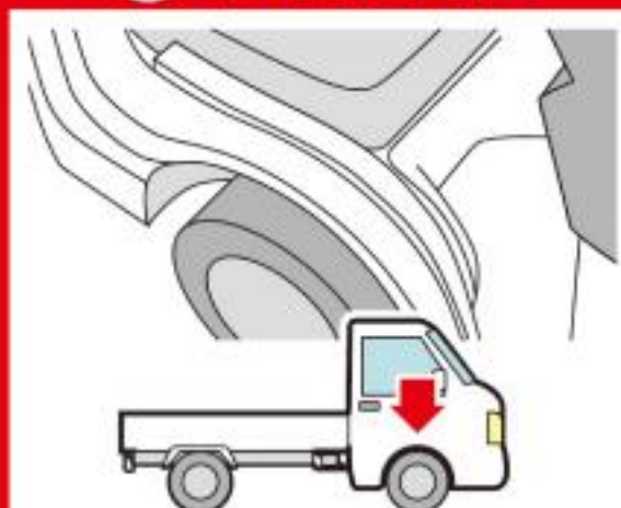
タイヤがシートの下にある軽トラック