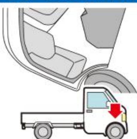
タイヤがフロントバンパー側にある軽トラック