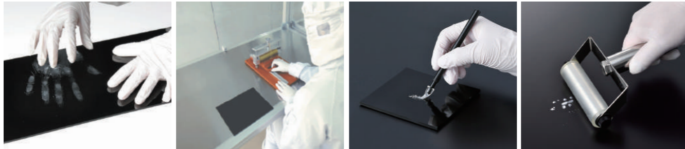
ウレタンゲルの力でほこりを転写・吸着する粘着シート