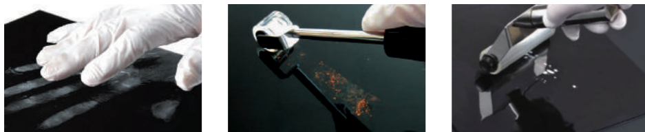
手袋を押し当ててほこりを除去