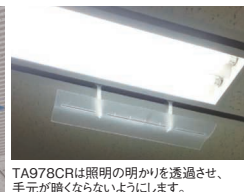
TA978CRは照明の明かりを透過させ、手元が暗くならないようにします。