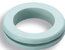
特注 (Green-gray) グリーングレー