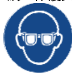
密閉度の高いゴーグル