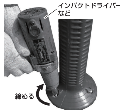
インパクトドライバーなど