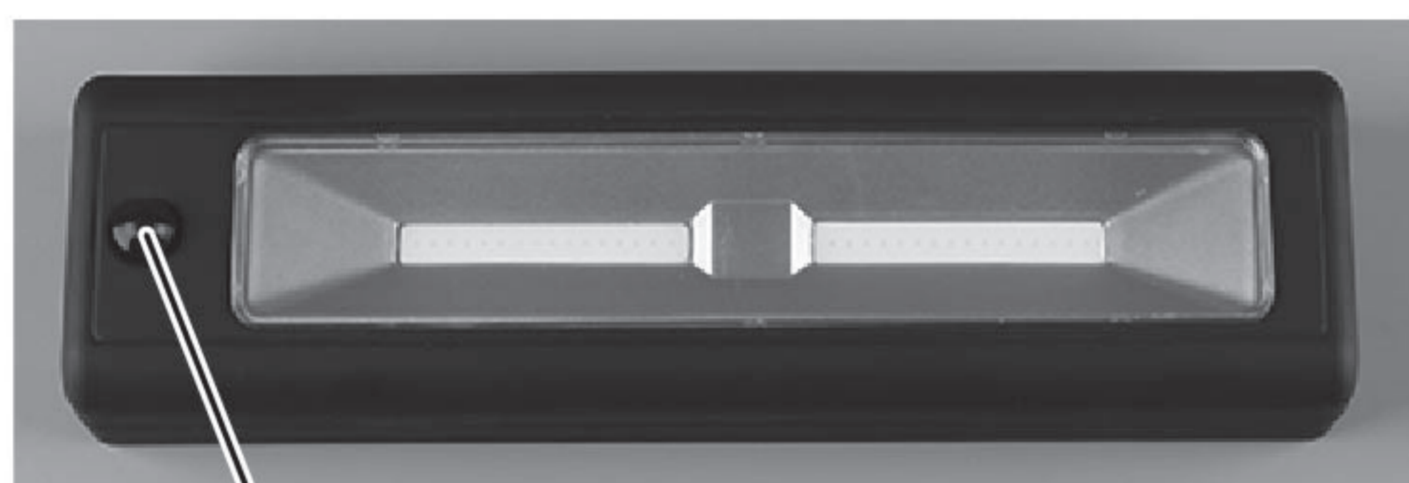
スイッチ (押すたびにライトがON/OFFになります。)