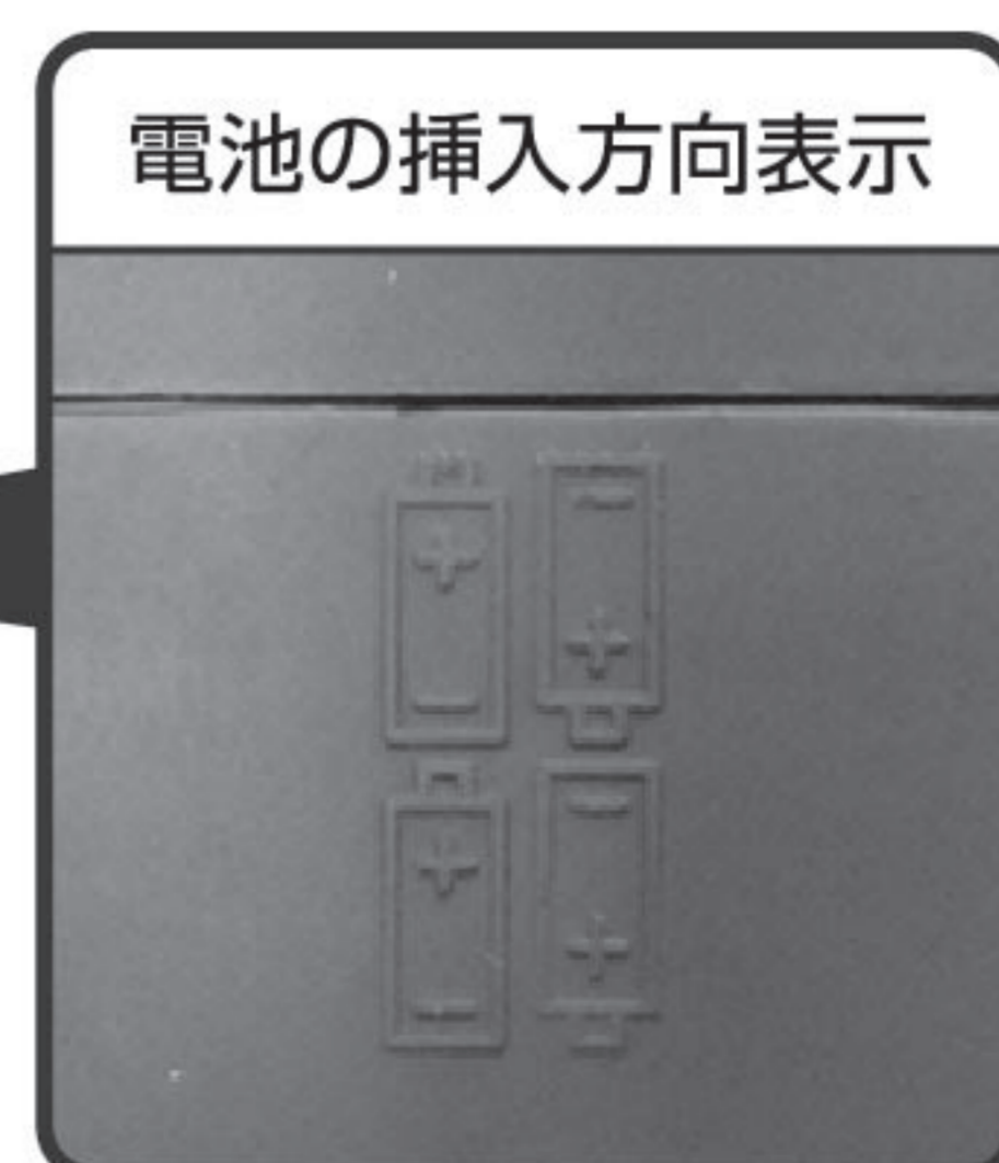
電池の挿入方向表示