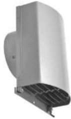
CRBG・CRSBGシリーズ スリムタイプ防音フード