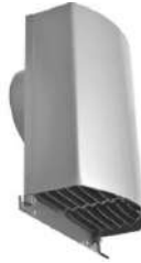
CRSGシリーズ スリムタイプ深型フード