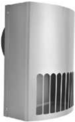
CKBシリーズ 結露受け付防音フード

対象製品 本説明書は次の製品を対象にしております。お手元にある製品をご覧のうえ、お取り扱い方法をご確認ください。