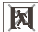
誘導灯 非常用照明器具