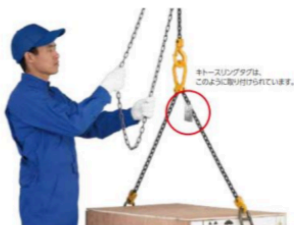
キトースリングタグ