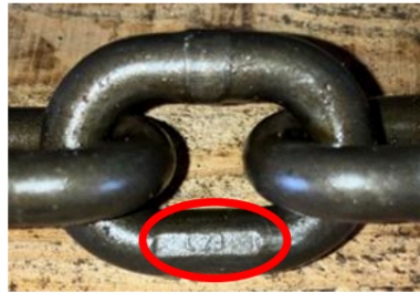
リンクチェーン SV2070 (φ7)