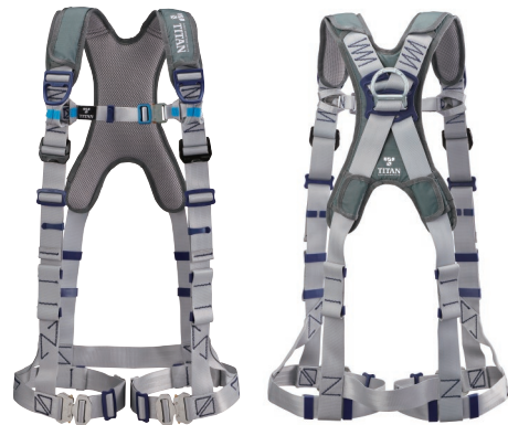
ベルトカラー：シルバー