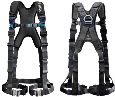
ベルトカラー：ブラック